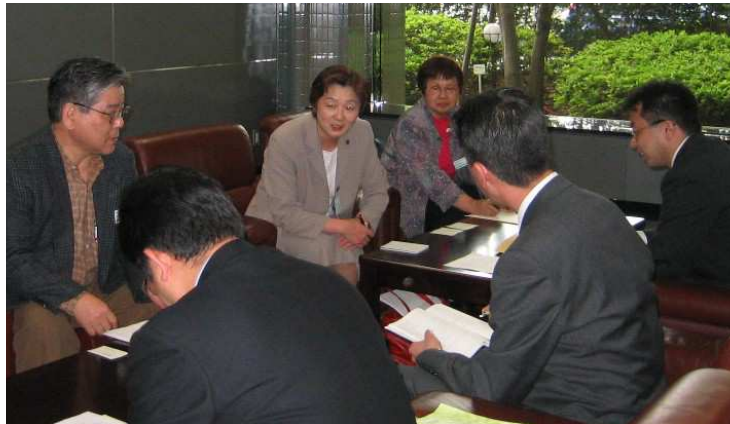
↑2005年4月26日 西武鉄道本社でバリアフリーと開かずの踏み切り解消について交渉